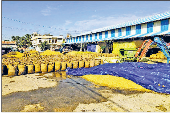
फतेहाबाद। बारिश से मंडी में भीगी फसल।

पश्चिमी विक्षोभ के चलते सोमवार को लगातार तीन घंटे हुई बारिश और तेज हवाएं चलने से तापमान में 8 डिग्री की गिरावट आ गई। बारिश से अनाज मंडियों और खरीद केंद्रों पर खुले में पड़ी धान की फसल भीगी गई। बारिश व तेज हवाओं के कारण खेतों में खड़ी धान की फसल बिछ गई जिसके चलते किसानों ने धान की कटाई रोक दी है। कृषि विशेषज्ञों का मानना है कि इस बारिश से कपास और धान की फसल को काफी नुकसान हुआ है। खासकर पिछले धान की फसल में ज्यादा नुकसान है। बता दें कि इन दिनों जिले में धान की कटाई का काम चल रहा है। कुछ किसान अपनी फसल लेकर अनाज मंडी में भी आने लगे हैं। पिछले दिनों मौसम वैज्ञानिकों द्वारा बारिश की भविष्यवाणी से ही किसानों की धड़कनें तेज हो गई थी। सोमवार को हुई बारिश के कारण फसलें प्रभावित हुई हैं। अब धान की फसल काटने के लिए उसके सूखने तक इंतजार करना पड़ेगा। मौसम विभाग ने बंगाल की खाड़ी