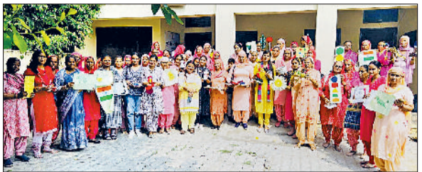
फतेहाबाद। कार्यशाला में भाग लेती महिलाएं।