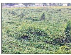
खेतों में बिछी धान की फसल।