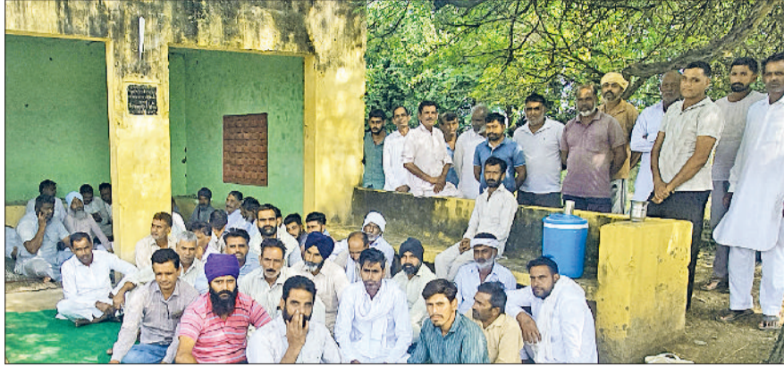
सिरसा। सिंचाई विभाग के खिलाफ धरना देते ग्रामीण।