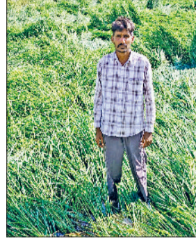
सिरसा। तेज आंधी के कारण जमीन पर बिछी धान की फसल।

सिरसा जिला में पश्चिमी विक्षोभ के सक्रिय होने से तेज आंधी के साथ हुई बरसात से धान की फसल को काफी नुकसान हुआ है। वहीं मौसम में भी टंडक घुल गई है। रविवार रात व सोमवार सुबह बरसात हुई नरमा, धान व बाजरे की फसल को नुकसान होने का अनुमान है। कई जगह पर तेज आंधी से धान की फसल बिछ गई। इसी के साथ ही कई जगह पर बिजली पोल व पेड़ गिर गए। जिससे वाहन चालकों को काफी परेशानी झेलनी पड़ी। इससे पहले रविवार को कई इलाकों में तेज बारिश, आंधी के साथ ओलावृष्टि हुई। चौपटा क्षेत्र में मानसून की बरसात से नरमा की फसल पहले ही खराब हो चुकी है। अब तेज आंधी व बरसात से धान की फसल बिछ जाने से किसानों को आर्थिक तौर पर काफी नुकसान हुआ है। किसानों ने बताया कि मानसून की बरसात से पहले चौपटा क्षेत्र में चोपट हो चुकी है। अब बरसात व तेज आंधी से फसलों को काफी नुकसान हुआ है। जिला प्रशासन को विशेष गिरफ्तारी करवा कर मुआवजा दिया जाए। कृषि विशेषज्ञों का भी कहना है कि खरीफ की अंतिम चरण में हुई बरसात से नुकसान की संभावना तो है, परंतु इससे मिट्टी की नमी बरकरार रहेगी, जिससे रबी सीजन की फसलों की पैदावार में सुधार होगा। कुल मिलाकर यह बरसात जहां एक