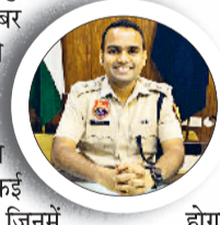
अधिकारी या विदेशी मित्र बताकर दावा करते हैं कि आपके नाम से विदेश से कोई महंगा गिफ्ट आया है। कभी-कभी इसमें सोना, हीरे-जवाहरात, नकद राशि या महंगे ब्रांडेड सामान का लालच दिया जाता है। इसके बाद कॉल, ईमेल या व्हाट्सएप संदेश भेजकर यह बताया जाता है कि पार्सल एयरपोर्ट के कस्टम विभाग में फंसा है और उसे छुड़ाने के लिए तुरंत टैक्स या शुल्क चुकाना होगा। शुरुआत में मामूली रकम मांगी जाती है, लेकिन एक बार भुगतान करने के बाद लगातार नए-नए चार्ज की मांग शुरू हो जाती है। पुलिस अधीक्षक ने बताया कि ऐसे स्कैम में ठग लालच और डर दोनों का इस्तेमाल करते हैं।