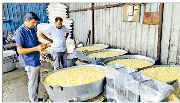
भट्टकला। हलवाई की दुकान में जांच करते अधिकारी।