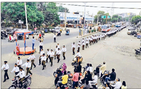
फतेहाबाद। पथ संचलन करते आरएसएस के स्वयंसेवक।