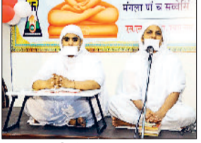
प्रवचन करती जैन साध्वियां।