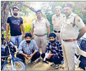
सिरसा। पकड़े गए अफीम तस्कर।