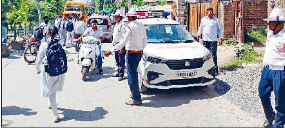
फतेहाबाद। वाहन की जांच करते ट्रैफिक पुलिस कर्मचारी।