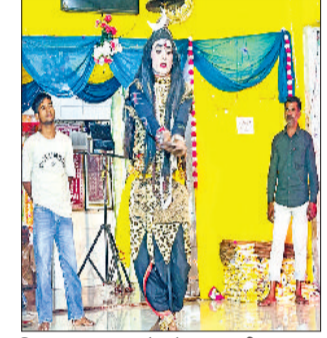
सिरसा। जागरण के दौरान झांकी प्रस्तुत करते कलाकार।